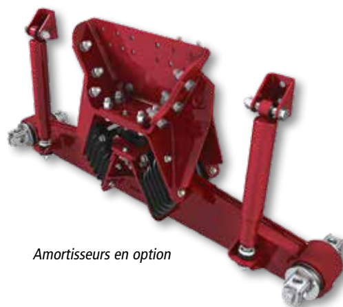
Amortisseurs en option

Documentation technique disponible au www.hendrickson-intl.com ou en nous contactant au 866.755.5968.